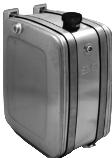
serbatoio olio 150 litri cod. 7.850 PE oil tank 150 litres code no. 7.850 PE