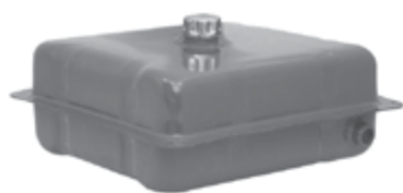
serbatoio olio 20 litri cod. 7.731 oil tank 20 litres code no. 7.731

I serbatoi sono completi di tappo (sempre) e livello visivo (ove previsto). Il filtro per il ritorno è da ordinare separatamente. Tanks are supplied complete with caps (always) and sight level (where offered). The return filter must be ordered separately.