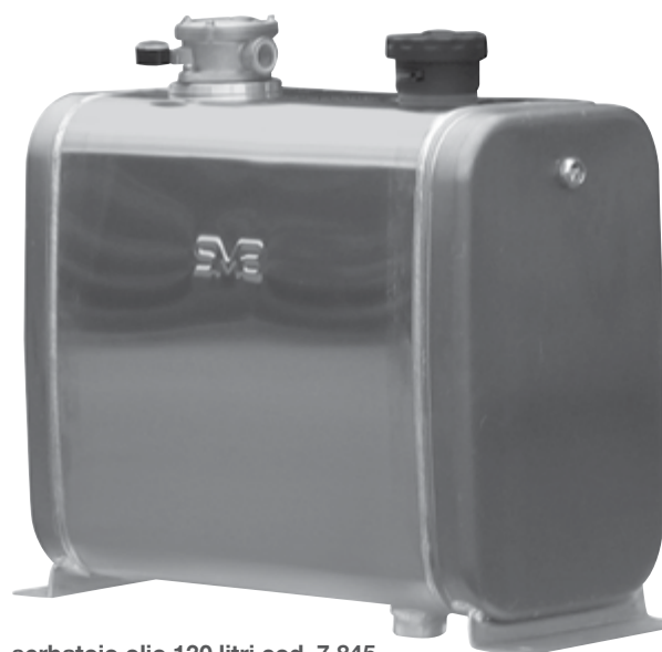
serbatoio olio 130 litri cod. 7.845 oil tank 130 litres code no. 7.845