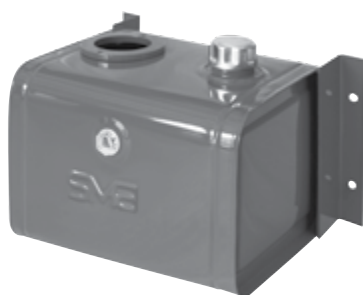
serbatoio olio 30 litri cod. 7.732 oil tank 30 litres code no. 7.732