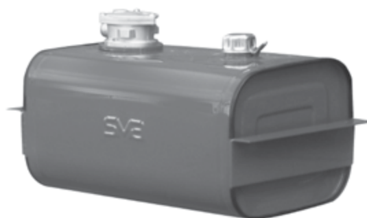
serbatoio olio 60 litri cod. 7.737 oil tank 60 litres code no. 7.737