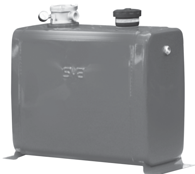
serbatoio olio 100 litri cod. 7.743 oil tank 100 litres code no. 7.743