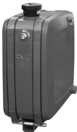
serbatoio olio 120 litri cod. 7.747 45 oil tank 120 litres code no. 7.747 45

I serbatoi sono completi di tappo e livello visivo Tanks are complete with cap and sight level