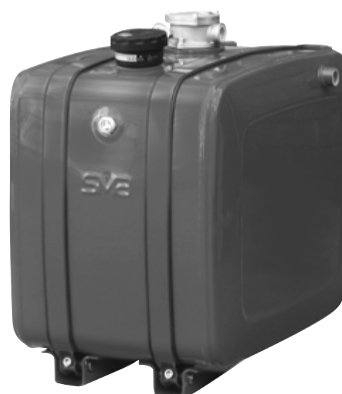
serbatoio olio 200 litri cod. 7.765 BD oil tank 200 litres code no. 7.765 BD

Il filtro ritorno è da ordinare separatamente Return filter must be ordered separately