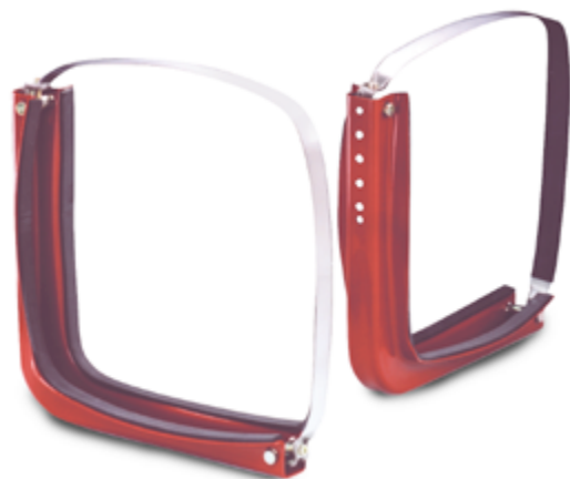
Staffe di supporto