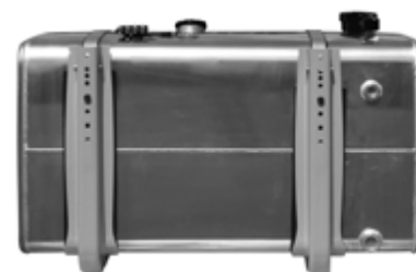
retro back side

Per il completamento del serbatoio misto con staffe, pescante e comando indicatore di livello, si rimanda alla pagina del veicolo di riferimento (Iveco, Scania, Mercedes, ecc) nella sezione Serbatoi Gasolio Maggiorati.