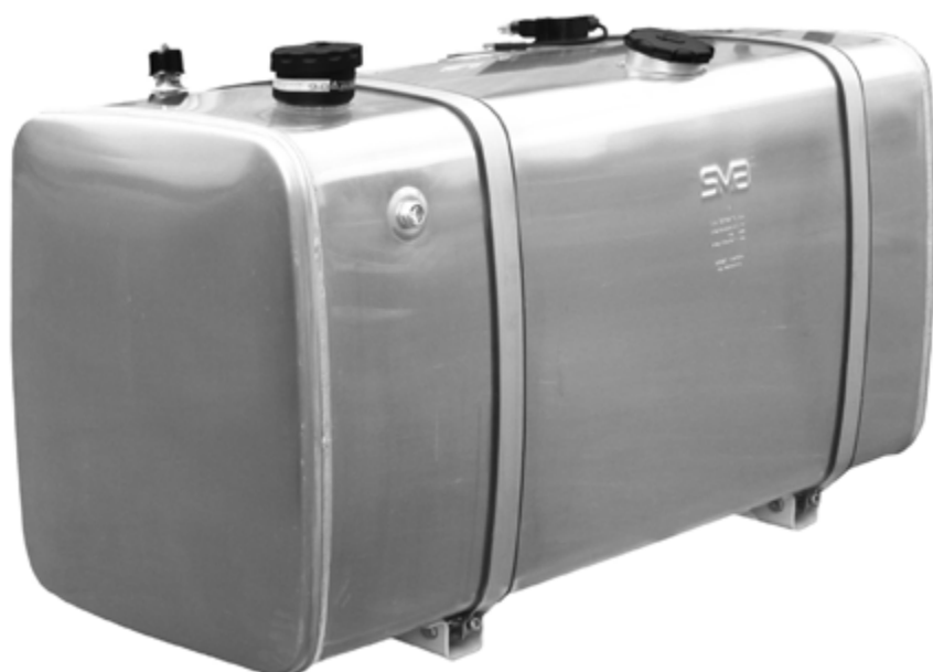
serbatoio misto 600 litri cod. 8M603 combitank 600 litres code no. 8M603

I codici sono riferiti al serbatoio nudo/Codes are referred to single tank