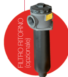
FILTRO RITORNO (opzionale)